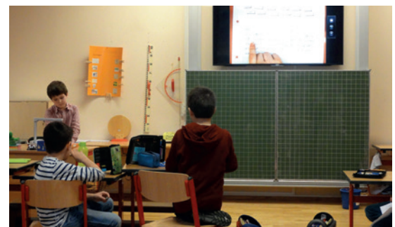
Die Schüler der Domsingschule nutzen im Unterricht aktiv die Möglichkeiten der neuen Medienausstattung.

Fazit: Eine wertvolle Investition in die Zukunft der Domsingschule und für die Kinder!