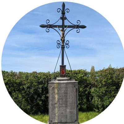
Wegekreuz zwischen Kornelimünster und Aachen.