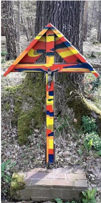
„Gedankenschleife“: Mit Wegekreuzen eine tolle Wanderung erleben.