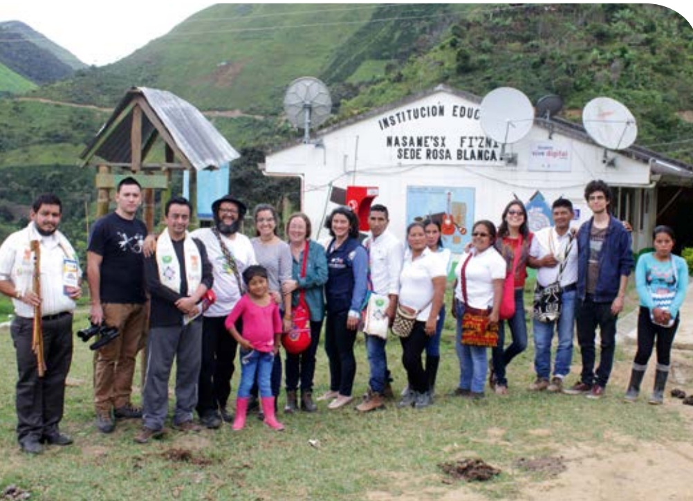
Mitarbeiter der Organisation Concern Universal in ihrem Indigen-Projekt.

Im September 2011 feierte das Bistum Aachen zusammen mit der katholischen Kirche Kolumbiens ihre 50-jährige Partnerschaft. Doch wie kam es dazu, dass das Bistum Aachen eine Partnerschaft mit einem Land führt, das 9.300 Kilometer Luftlinie entfernt ist?