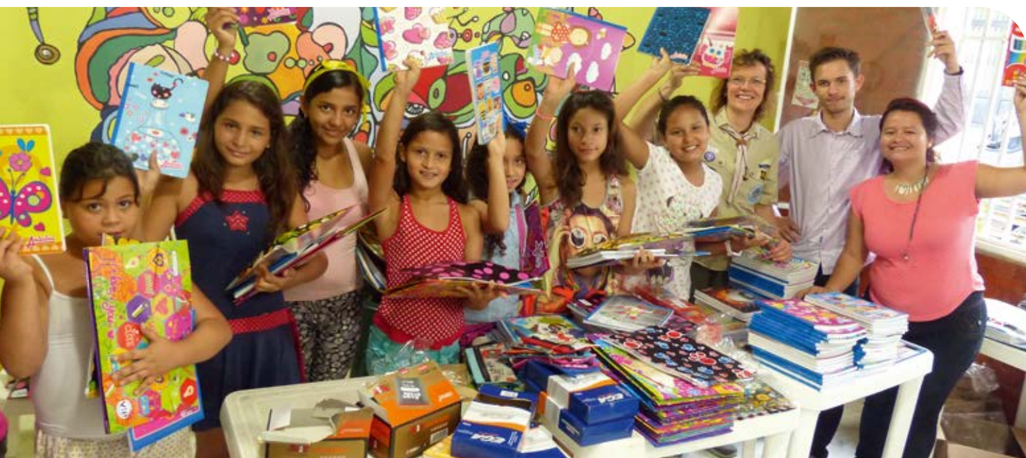
Kinder und Jugendliche von Sueños Especiales erhalten Schulmaterial durch Spender des DPSG Diözesanverband Aachen.

Juntos construimos un mundo mejor – Zusammen bauen wir eine bessere Welt. Das ist der Leitsatz der Organisation Sueños Especiales in Kolumbien.