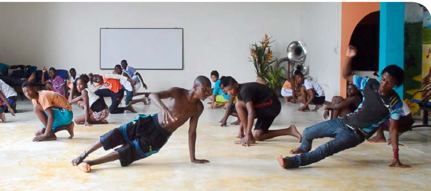
Tanz - Kunstworkshops für Jugendliche in der Stadt Quibdó.

Wie Sozialpastoral im Chocó mit politischem Engagement an den Lebensbedingungen mitarbeitet