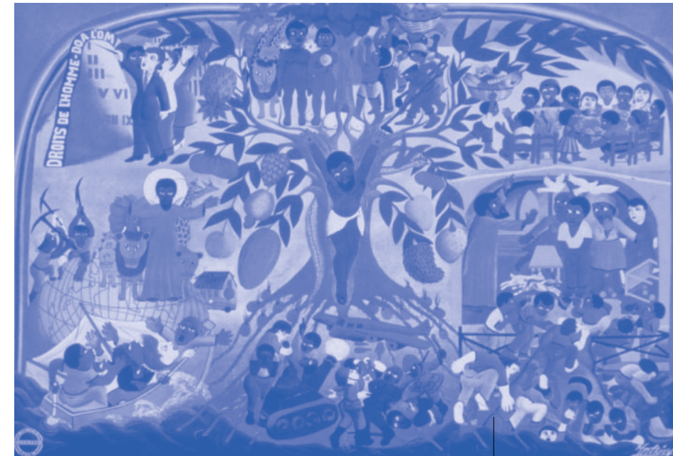
Haiti'den Jacques Chéry'nin eseri Perhiz örtüsü © MVG Medienproduktion, Aachen 1982

Hristiyanlar, imanlıların topluluğunda, yani Kilise'de Mesih olarak da adlandırdıkları İsa ile beraber olduklarına inanmaktadırlar. Kilise, ilk hristiyanların iman mirasını nesilden nesile taşımaktadır. Hiç kimse yalnız kendisi için hristiyan olamaz. İsa'nın ölümü, dirilişi ve göğe yükselişinin ardından ilk hristiyanlar ve başkaları Kudüs'te toplanmışlardı. Kutsal Ruh onların üzerine inmiş ve onlara cesaret vermiştir. Pentekost bayramında hristiyanlar Kutsal Ruh'un bu lütfunu ve Kilise'nin doğuşunu anmaktadırlar. Kilise günümüze dek üyelerinin (Episkoposlar, Rahipler, Tarikat Üyeleri ve diğer imanlılar) değişik hizmetleri aracılığıyla, Tanrı'nın insanlara yönelik lütfuna aracılık etmektedir. İman gizemleri olan sakramentlerle, imanlıların yaşamlarına eşlik etmekte ve anlam kazandırmaktadır. Kilise'ye aidiyetin temeli vaftiz sakramentinde atılır. Aynı şekilde bir hristiyanın bir hristiyanla evliliği, ya da rahipliğe kutsanmak da sakramentlerdir.