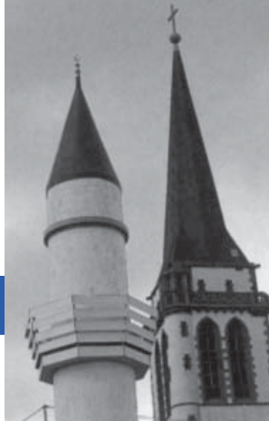
Mannheim'da birbirine komşu cami ile kilise