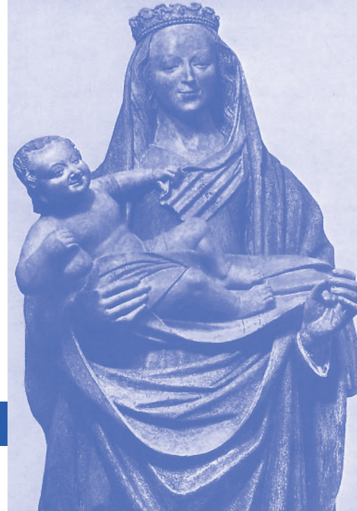
Münster St. Ludgeri Kilisesi'ndeki, Burgund'dan sevinçli Meryem Ana heykelciği

Tanrı'nın vaadi, O'nu "olduğu gibi göreceğimizdir" ( İncil, Yuhanna'nın 1.Mektubu, Bölüm 3, Ayet 2 ). İşte "Cennet" budur. "Cehennem" ise Tanrı'dan uzak kalmaktır. İsa, tekrar gelişine kadar Kilisesi aracılığıyla ve Kilisesi'nde mevcuttur. "İşte ben, dünyanın sonuna dek her an sizinle birlikteyim" ( İncil, Matta, Bölüm 28, Ayet 20 ).