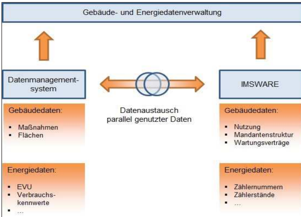
Abbildung 28: Datenfluss in der Energie- und Gebäudedatenverwaltung

Für die Umsetzung des Controllingkonzeptes sind folgende Maßnahmen vorgesehen