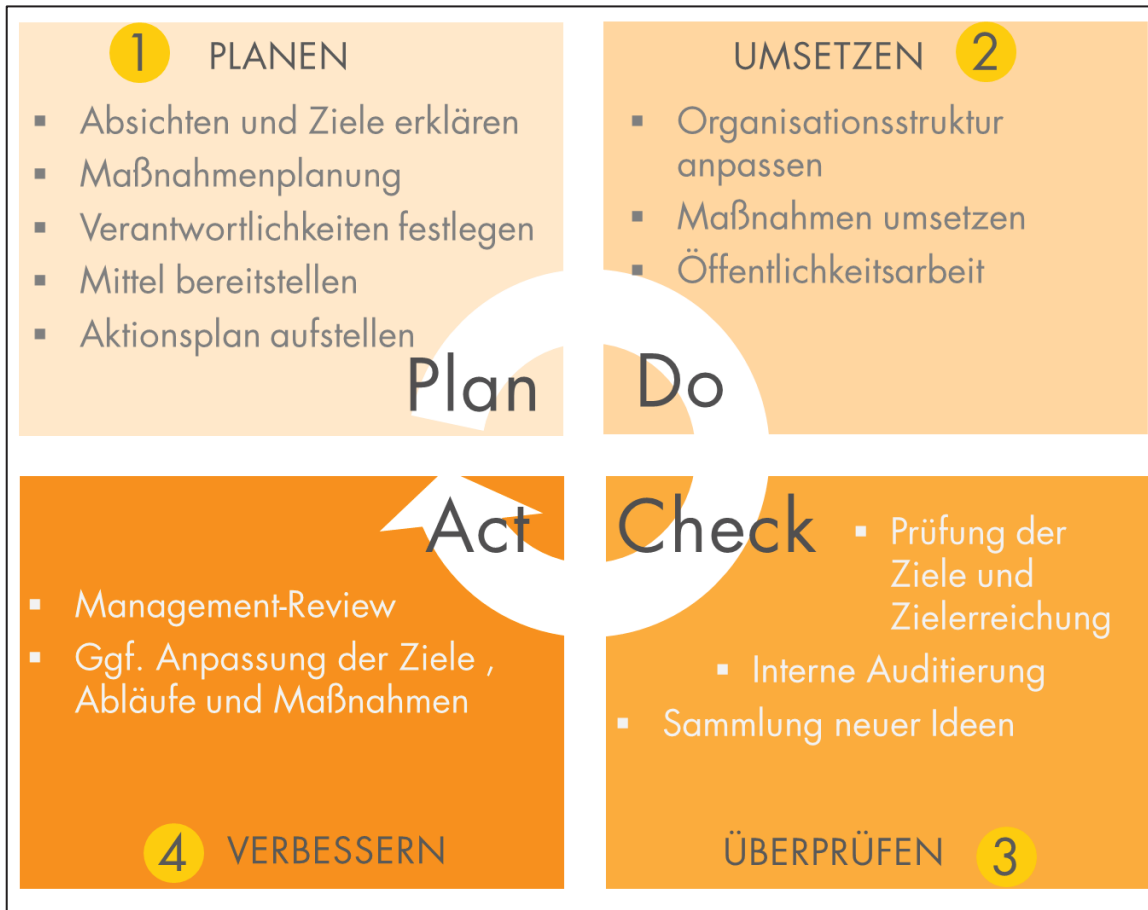
Abbildung 32: Regelkreis für das Energiemanagement

Zunächst wurden die Zuständigkeiten und Aufgabenbereiche der für die Umsetzung der Maßnahmen erforderlichen Akteure dargestellt. Grundlage ist der Plan-Do-Check-Act Zyklus der DIN EN ISO 50001 (Energiemanagementsysteme).