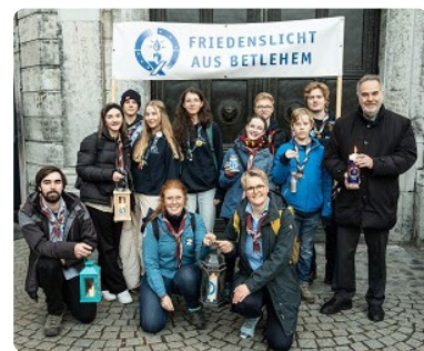
Das Friedenslicht ist in Aachen angekommen.

Das Friedenslicht ist den langen Weg aus Bethlehem in unserem Bistum angekommen. Es ist ein Zeichen für Hoffnung, Freundschaft, Gemeinschaft und Verständigung aller Völker und wird von Pfadfinderinnen und Pfadfindern verteilt. Nach der Aussendungsfeier in Heilig Geist, Aachen, brachte es eine kleine Gruppe zum Dom und ins Generalvikariat.